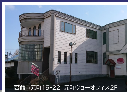
函館市元町15-22 元町ヴェーオオフィス2F

一人ひとりに合わせた学習プランを提案します。 まずはお気軽にお問い合わせください。